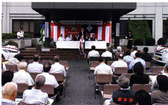
去る8月30日、地域支え合い運送事業を行うための協定締結式ならびに車両の引き渡し式がありました。

草津市長ご臨席のもと、多くの来賓や関係者の見守る中、盛大に式典が挙行されました。