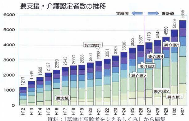
資料：「草津市高齢者を支えるしくみ」から編集

このため、いま「地域包括ケアシステム」の構築を目指しています。 下の図は、地域包括ケアシステムの五つの構成要素（住まい・医療・介護・予防・生活支援）をより詳しく、またこれらの要素が互いに連携しながら有機的な関係を担っていることを図示したものです。 地域における生活の基盤となる「住まい」「生活支援」をそれぞれ、植木鉢、土と捉え、専門的なサービスであ